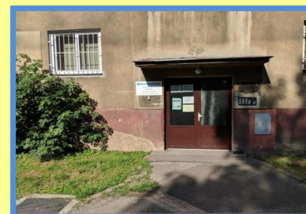
Kancelář terénního programu