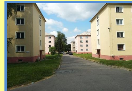
ulice U Svobodáren

Pro více fotek z míst, kde můžete terénní sociální pracovníky najít, se podívejte na náš Facebook.